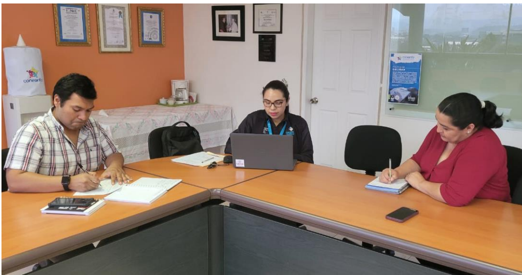
Primera Visita de Mejora Continua por la ONADICI.